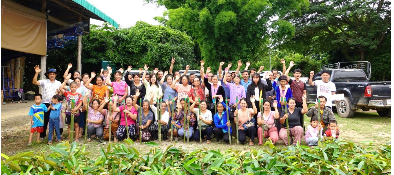
第 1 回配布 ドリアン・アボカド・マンゴー・リュウガン・オレンジなど 5,000 本